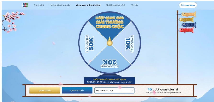
(Hình ảnh minh họa)