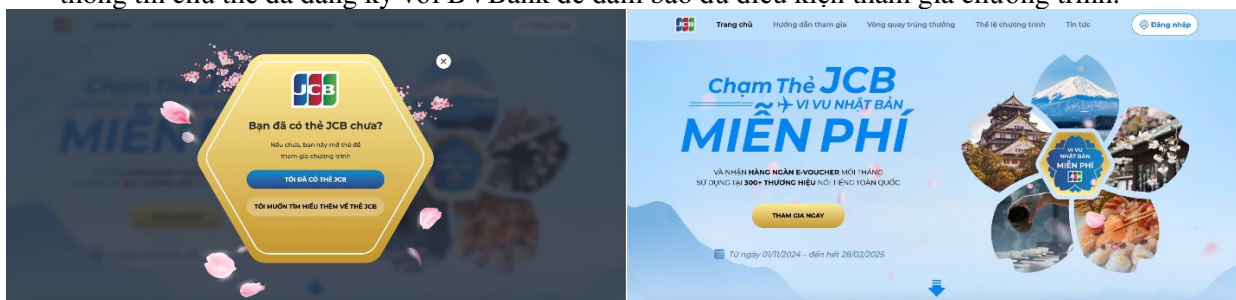
(Hình ảnh minh họa)

Thông tin để đăng ký tài khoản tham gia chương trình bao gồm: