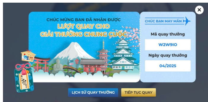
(Hình ảnh minh họa)