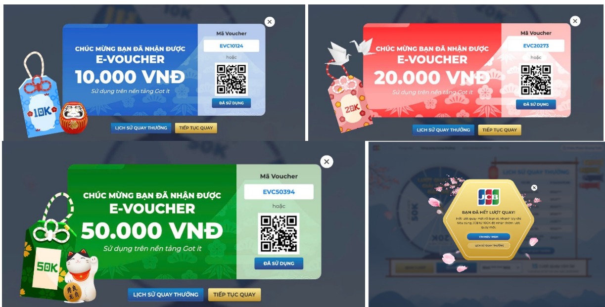
(Hình ảnh minh họa)